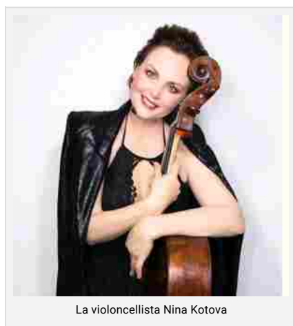
La violoncellista Nina Kotova

Vocalise di Rachmaninoff, la Sonata di Britten, la Sonata di Chopin e Le Grand Tango di Piazzolla. Pagine capolavoro della letteratura musicale incorniciate da brani che stringono l'occhio anche al pubblico meno esperto.